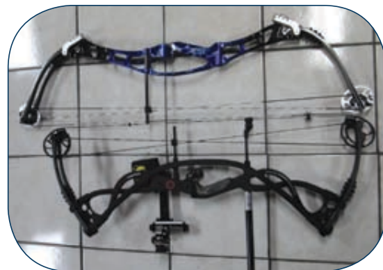
Arco de 41 con arco de 35.

5.- Los arcos más largos de eje a eje son más precisos: Este mito urbano fue derrumbado varias veces por tiradores de calidad mundial como Chris White de Gran Bretaña, poseedor de varios record mundiales, Chris mide alrededor de 1.90mts, usa un arco de 32 de jalón y sus mejores tiros los he visto con arcos de no más de 34" de eje a eje. Dave Cousins ganó una medalla de