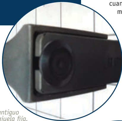
Arco antiguo con cajuela fija.

Espero que este artículo haya ayudado a derrumbar a algunos mitos y te ponga a entrenar duro para ese objetivo, ya sea torneos locales, de 3-D, Selectivos, cacerías o por el placer de disparar una flecha y que impacte en la zona y te de la satisfacción que me ha dado este gran deporte. Cualquier duda o comentario escríbeme a ruben@soloarqueria.com y estaré gustoso de contestar tus dudas o preguntas. ▀