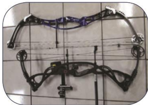
Arco de 41 con arco de 35.

5.-Los arcos más largos de eje a eje son más precisos: Este mito urbano fue derrumbado varias veces por tiradores de calidad mundial como Chris White de Gran Bretaña, poseedor de varios record mundiales, Chris mide alrededor de 1.90mts, usa un arco de 32 de jalón y sus mejores tiros los he visto con arcos de no más de 34" de eje a eje. Dave Cousins ganó una medalla de